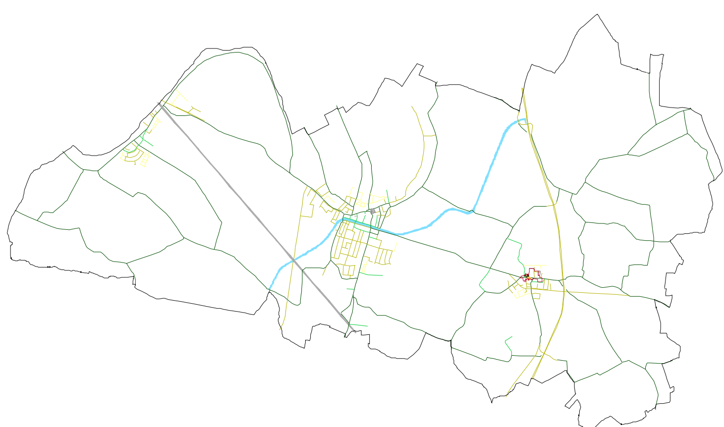
QUADRO COMPLESSIVO DI EVOLUZIONE DEL SISTEMA DELLA VIABILITA' - SCALA 1:65.000